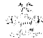
TABELA EXPLICATIVA DA EVOLUÇÃO DA RECEITA E DA DESPESA